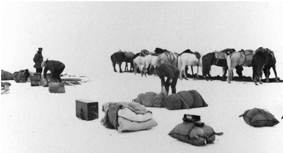
Mynd 8 Áð á jöklinum og hugað að búnaði.

Sigurður kom út til hjálpar en Lundager lá áfram í poka sínum. Mjög var dregið af Wegener og lagðist hann strax fyrir. Á meðan Sigurður aðstoðaði Vigfús við að ganga frá hestum og farangri tók Koch að hafa til þemmikan 24 handa þeim ferðalöngum. Frétti hann þá að Sigurður og