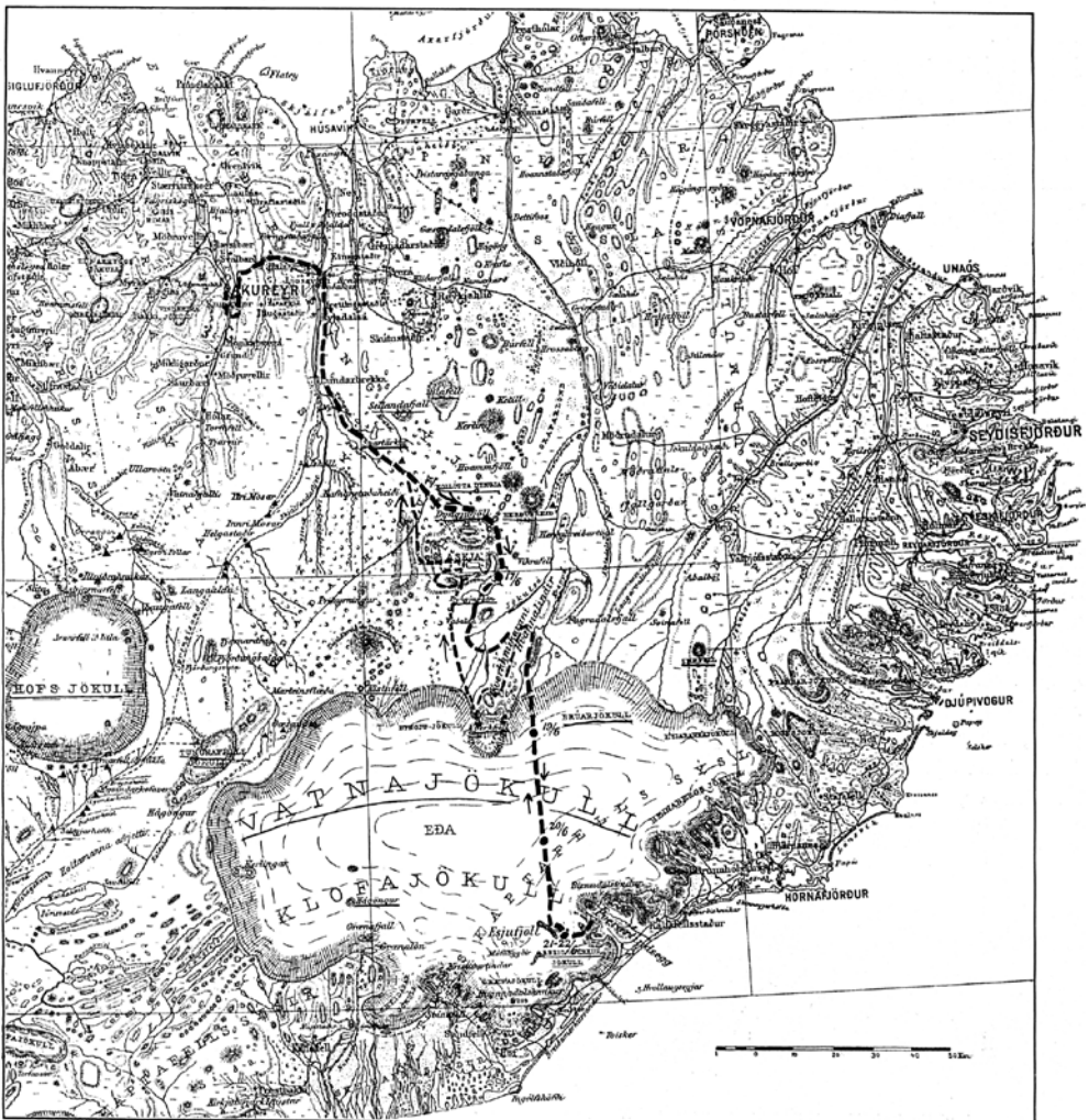
Mynd 1 Kort Kochs af ferðinni um þvert Ísland, sem birtist með grein hans í danska landfræðiritinu Geografisk Tidsskrift haustið 1912.

Leitast verður við að svara spurningum eins og þessum: Hvernig gekk að hrista saman þá ólíku menn að stétt og uppruna sem áttu í vændum að dvelja langtímum saman í einangrun, myrkri og fimbulkulda? Hvernig reyndust íslensku hestarnir? Af hverju ákvað Koch að nota frekar hesta en sleðahunda? Hvernig