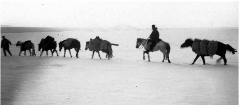
Mynd 7 Hestalestin á leið yfir Vatnajökul.

Næsta morgun var niðarþoka – þeir átta-vitalausir og Herðubreið löglega afsökuð. Þegar þeir lögðu af stað um hádegi grúfði