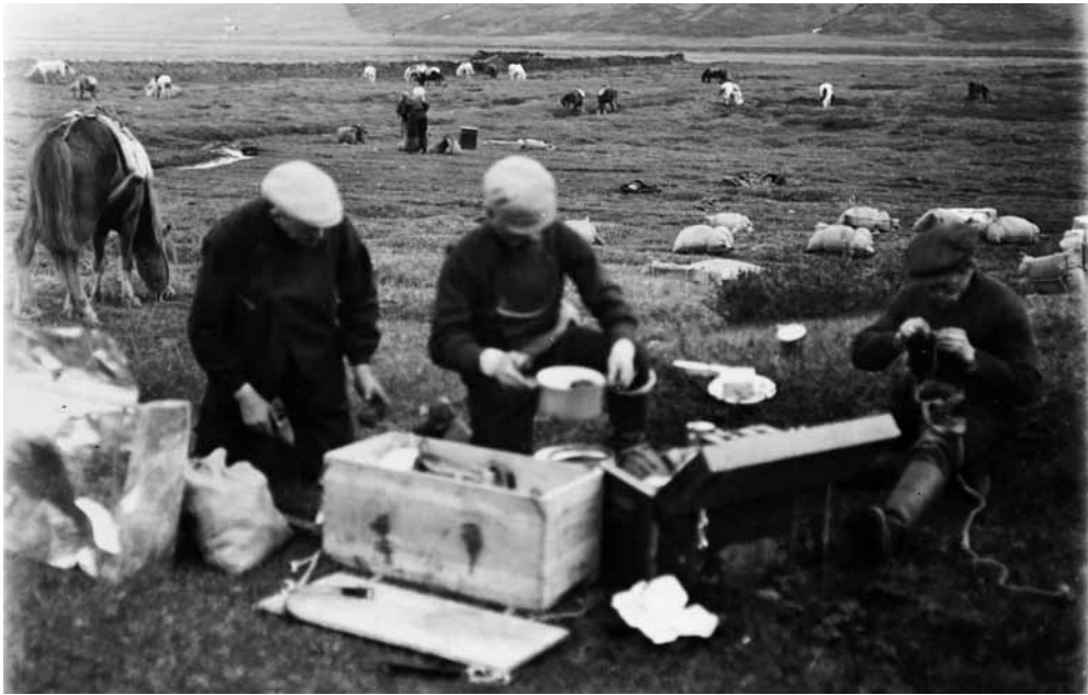
Mynd 4 Áð í Fnjóskadal. Nýja ‚prímusvélín‘ og önnur mataráhöld notuð í fyrsta sinn.

nóvember 1913). Sama blíðan ríkti sem fyrr og miklar mannaferðir voru í námunda við Ljósavatn, því Þingeyingar hugðust halda þar sumarblót.