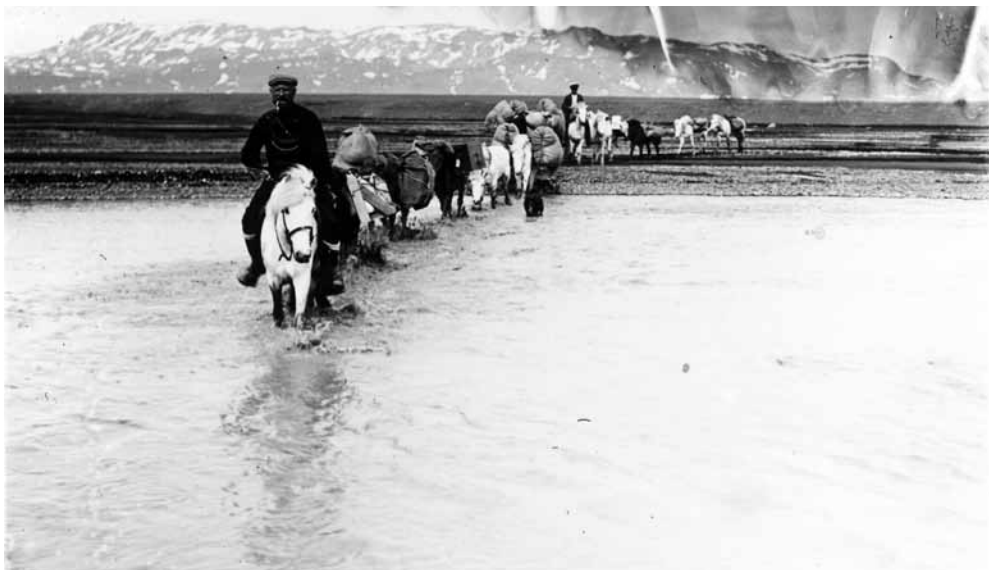
Mynd 5 Koch ríður yfir Jökulsá. Hann varð fyrir vonbrigðum yfir því hvað hún var vatnslítill.

Þeir sváfu venju fremur vel þessa nótt. Veðurbliðan hélst áfram og þeir gáfu sér góðan tíma til að gera klárt fyrir ferðina á jökulinn. Klukkan var nærri fjögur þegar