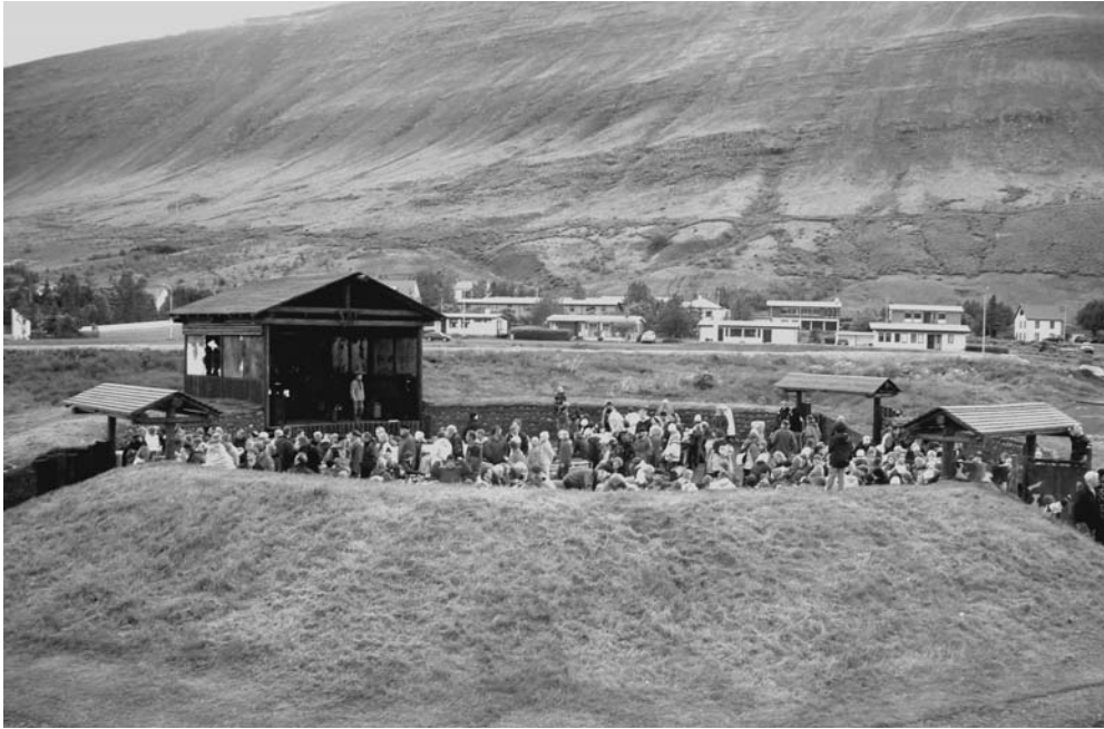
Mynd 3 Samkoma í Víkingabúðum.

Víkingabúðirnar eru ein afurð margleits gerendanets Víkinga á Vestfjörðum. Þær eru myndbirting tengslagjörða sem leggja til við sköpun eða verðandi Þingeyrar sem staðar á mjög efnislegan hátt. Þær eru ekki aðeins torf og grjót heldur einnig frásögn um þessa sömu verðandi, um möguleika, vonir og áætlanir, til dæmis um hvernig Víkingabúðirnar munu tvinnast saman við samfélagið í framtíðinni. Margir tala um Víkingabúðirnar sem félagsheimili. Þeim er lýst sem allsherjar samkomustað fyrir allt þorpið (mynd 3), fyrir ættarmót og afmæli, fyrir ferðafólk af tjaldstæðinu og að sjálfsögðu fyrir Víkinga. 5 Notkun Víkingabúðanna á eftir að mótast, rétt eins og Þingeyri sem staður heldur áfram að gerast. Verkefnið hefur hnikað staðnum, en framundan eru margar mögulegar leiðir sem þurfa ekki að útiloka hver aðra.