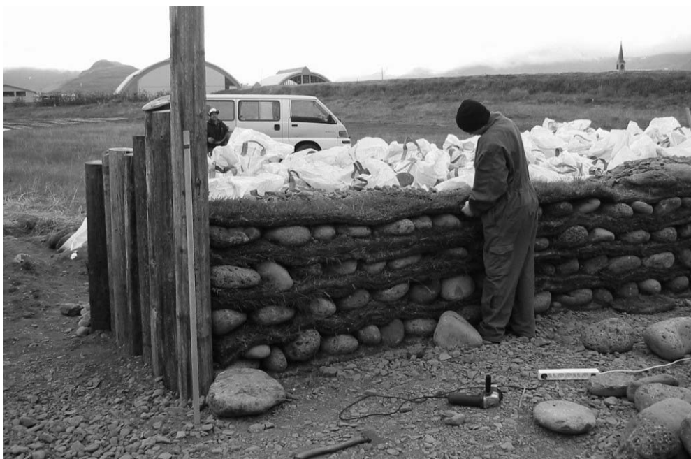
Mynd 2 Unnið að hleðslu Víkingabúðanna.

töluverðu vandamáli. Grjótið sem var tiltækt á svæðinu var ekki sérstaklega gott hleðslugrjót. Það var lábarið fjörugrjót með ávöllum útlinum. Besta grjótið til hleðslu er hellulaga. Þess háttar grjóts var erfitt að afla. Það er að finna uppi á heiðum, en ekki í næsta nágrenni við Þingeyri. Smiðirnir, fjörugrjótið, stjórn Víkinga á Vestfjörðum, Samson og hleðslumeistarinn urðu að semja. Útkoman var hleðsluaðferð sem fjörugrjótið frá Dýrafirði var tilbúið til að setta sig við (mynd 2). Aðferðin fólst í að nota mold og torf til að gefa hleðslunni meiri stöðugleika. Í stað grjóthleðslu var endunum á hringnum, við innganga, lokað með timbri. Það kom þeim sjálfum á óvart hvað þessi aðferð var árangursrík og í rauninni mun fljótlegr en hefðbundin hleðsla þó hún sé ekki eins endingargóð.